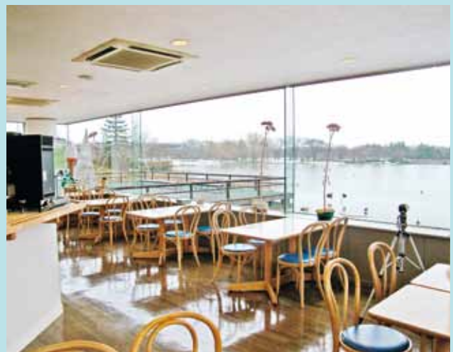
喫茶室の明るい室内

営業時間は、午前10時～午後4時半で、メニューには、コーヒーや紅茶、果物の生ジュースなどの飲み物から、手作りケーキにマンゴー・チョコ・抹茶のソフトクリームなどのスイーツ、ランチメニューとしては、手作りサンドイッチや白えびかき揚げそば、カレーライスなどがあります。ぜひ喫茶室をご利用ください。