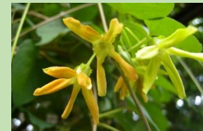
イエアリシャン【熱帯雨林植物室】