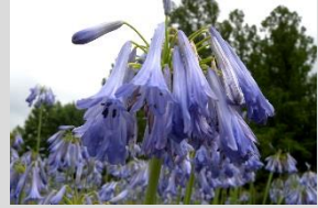
アガパンサス【球根の植物】