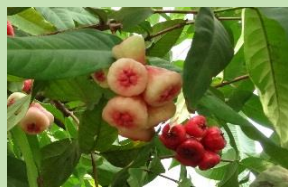
レンブ【熱帯果樹室】