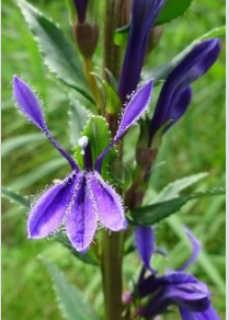
サウギキョウ【湿地の植物】