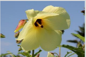
トロリアオイ【繊維の植物】