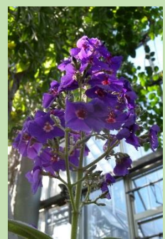
オオバシコンノボタン【熱帯雨林植物室】