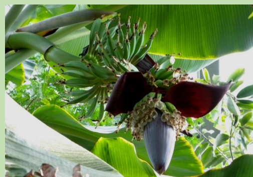
料理用バナナ【熱帯果樹室】