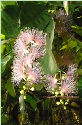
サガリバナ【熱帯雨林植物室】