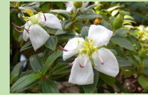
ムニンノボタン【ラン温室】