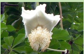
バオバブ【熱帯果樹室】