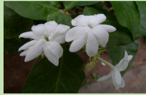
マツリカ【熱帯雨林植物室】