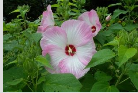
アメリカフヨウ【芝生広場】