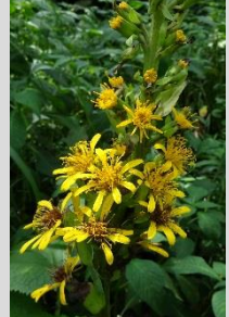
オタカラコウ【湿地の植物】