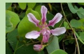
ウナンソシンカ【雲南温室】