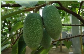
カンテンイタビ【雲南温室】