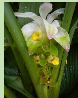
ウコン【熱帯雨林植物室】