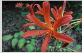
キツネノカミソリ【シイ・カシの森】