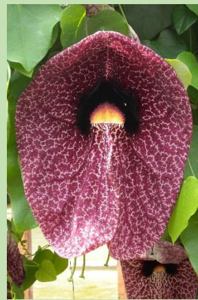
アリストロキア・ギガンティア【熱帯雨林植物室】