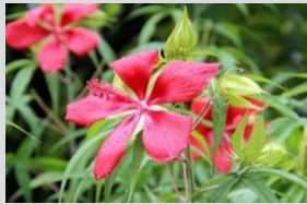
モミジアオイ【北米東部の植物】