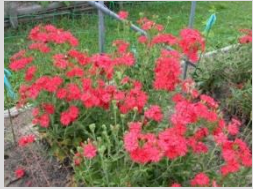
センノウ【くすりの植物】