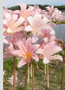
ナツズイセン【球根の植物】