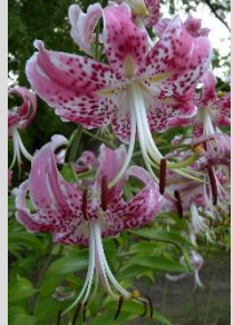
カノコユリ【北米東部の植物】