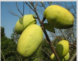
カリン【サクラ・ウメ園】