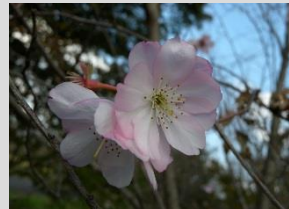
アーコレード【サクラ・ウメ園】