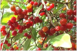
アキグミ【河原の植物】