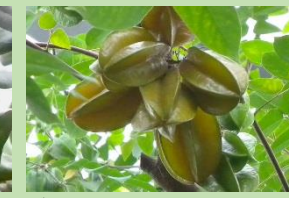
ゴレンシ【熱帯果樹室】