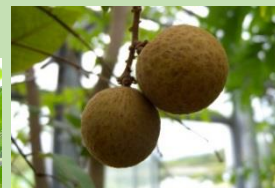
リュウガン【雲南温室】