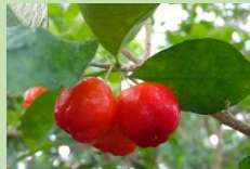
バルバドスチェリー【熱帯果樹室】