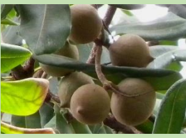
マカダミア【熱帯果樹室】