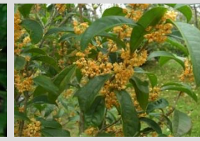
キンモクセイ【香りの植物】