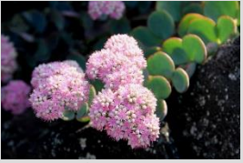
エッチウミセバヤ【ロックリー】