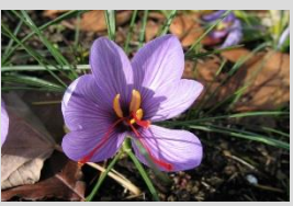
サフラン【染の植物】