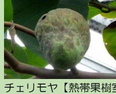
チェリモヤ【熱帯果樹室】