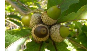
ミズナラ【ミズナラ・ブナの森】