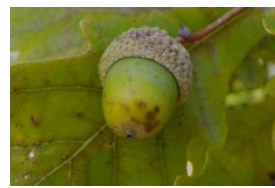
アカガシワ【芝生広場】

「どんぐり」はブナ科のコナラ属、カシ属、マテバシイ属、クリ属、シイ属、ブナ属の果実の総称です。ブナ科植物は暖帯から温帯にかけて分布し、暖帯では常緑のシイ・カシ類が照葉樹林の主要構成樹種であり、温帯ではブナ・ミズナラなどが落葉広葉樹の中で占める割合が大きいです。どんぐりは肥大した子葉にデンプンを蓄え、たくさん実ることから、森に棲んでいるネズミ、リス、クマなどの哺乳類にとって秋の重要な食料となっています。どんぐりの出来不出来が、森に棲む野生動物の秋から冬の生存に大きな影響をもたらします。2004年の秋はどんぐりが不作だったため、北陸地方では多数のツキノワグマが人里に出没しました。