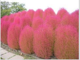
ホウキグサ【フローラルステージ】