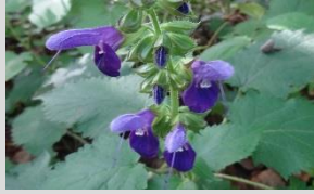
オオアキギリ【シイ・カシの森】