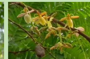
タマリンド【熱帯果樹室】