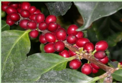
アラビアコーヒーノキ【熱帯果樹室】