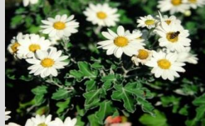
サツマノギク【海岸の植物】