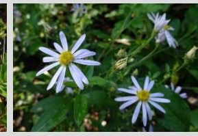
ノコンギク【クリ・コナラの森】