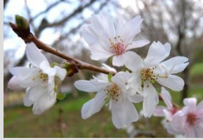
シュウガツザクラ【サクラ・ウメ園】