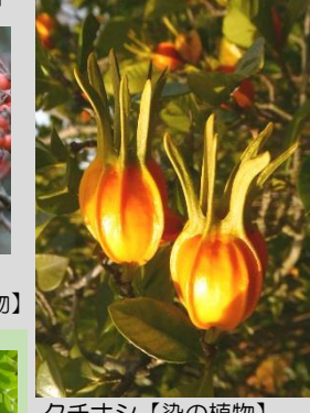
クチナシ【染の植物】