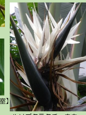
ルリゴクラクチョウカ【熱帯果樹室】