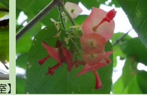
テングバナ【熱帯雨林植物室】