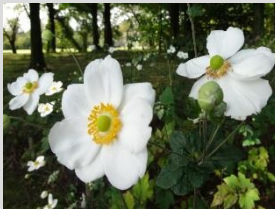
シュウメイギク【北米東部の植物】