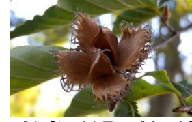
ブナ【ミズナラ・ブナの森】