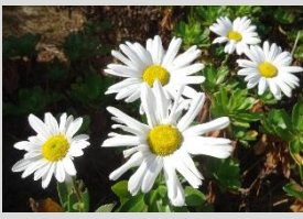
ハマギク【海岸の植物】