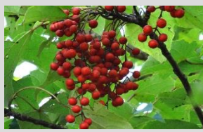
イイギリ【シイ・カシの森】