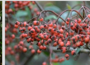
セイナンシャリントウ【雲南の植物】