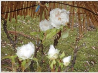
寒ボタン【ボタン・シャクヤク園】