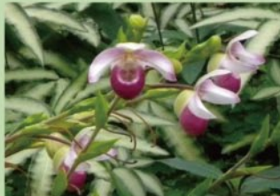
フラグミペディウム【ラン温室】