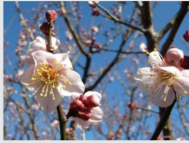
ウメ '紅冬至' 【サクラ・ウメ園】