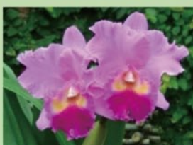
カトリア【ラン温室】