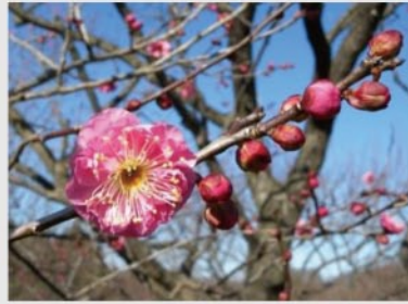
ウメ '八重寒紅' 【サクラ・ウメ園】