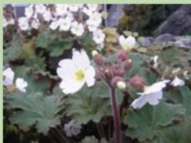
プリムラ・シネンシス 【高山・絶滅危惧植物室】