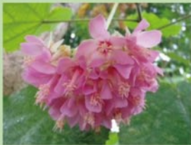
ドンペア【熱帯雨林植物室】