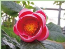
ハイドゥンツバキ 【雲南温室】