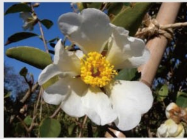
ユチャ【雲南の植物】