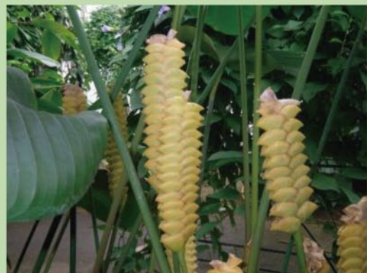
カラテア【熱帯雨林植物室】 黄色い苞（ほう）が二列に重なり合ってつく風変わりな花序（かじょ：花の集まり）は、ガラガラヘビの尾の先端のガラガラと似ています。