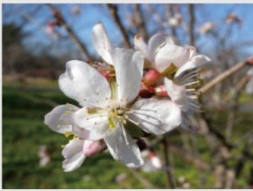
フユサクラ【サクラ・ウメ園】