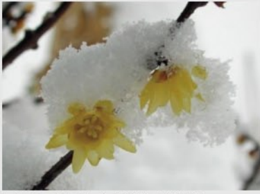
ソシンロウバイ【香りの植物】