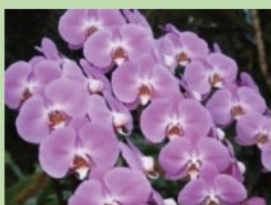
コチョウラン【ラン温室】