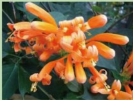
カエンカスラ 【熱帯雨林植物室】