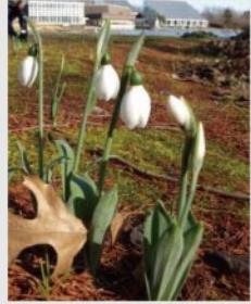
オオマツユキソウ 【北米東部の植物】