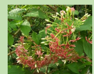
シクンシ【熱帯雨林植物室】