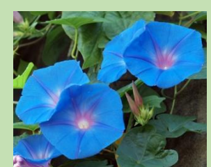
ノアサガオ 'オーシャンブルー'【熱帯雨林植物室】