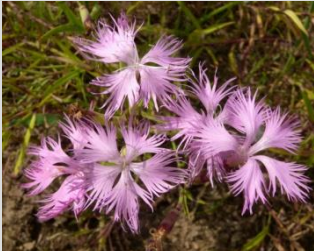
カワラナデシコ【低地草原】