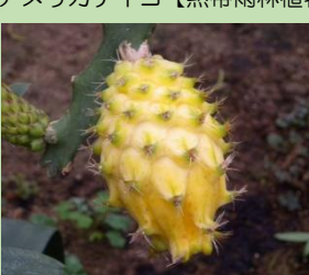
イエローピタヤ【熱帯雨林植物室】