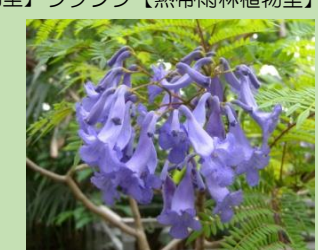
ジャカラダ【熱帯雨林植物室】