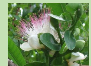
ゴバンノアシ【熱帯雨林植物室】