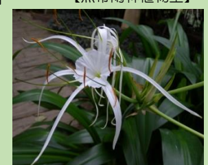
ヒメノカリス・スペキオサ【熱帯雨林植物室】