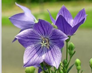
キキョウ【低地草原】