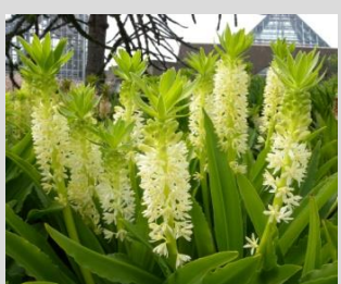
パイナップルリリー【北池南岸】