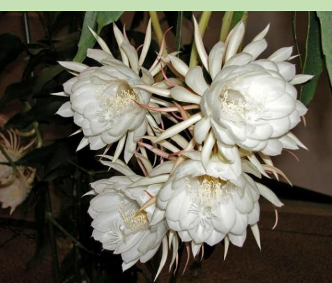
ゲッカビジン【熱帯雨林植物室】