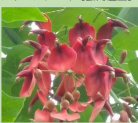
アメリカテイゴ【熱帯雨林植物室】