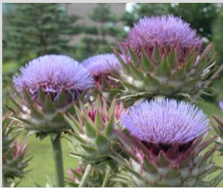
アーティチョーク【雲南温室前】