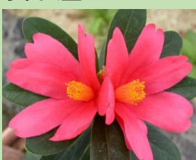
アザレアツバキ【雲南温室】