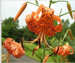
オニユリ【河原の植物】