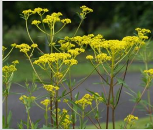
オミナエシ【低地草原】