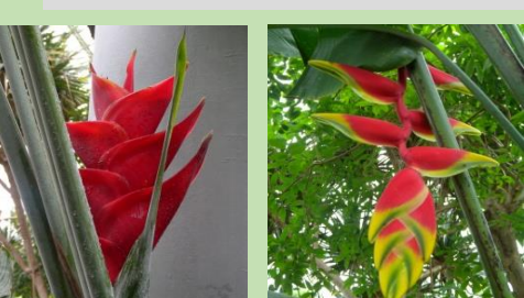
ヘリコニア・カリバエア ヘリコニア・ロストラタ【熱帯雨林植物室】