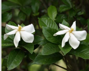
クチナシ【染めの植物】