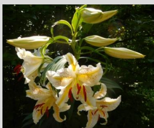
ヤマユリ【クリ・コナラの森】