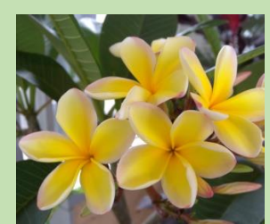
プルメリア【熱帯雨林植物室】