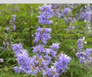
セイヨウニンジンボク【繊維の植物】