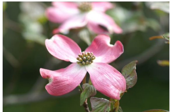
写真2 ハナミズキの花

この樹木はミズキ科ヤマボウシ属の落葉樹で、アメリカ東部海岸からメキシコにかけて分布しています。高さは5~12mです。1912年、東京市長尾崎行雄がアメリカにサクラを送った返礼に、アメリカから送られた樹木としても有名です。日本には本来生息していない樹木ですが、日本のヤマボウシによく似ていることから、アメリカヤマボウシとも呼ばれます。ヤマボウシとの違いは花の咲く順番が違います。ヤマボウシは葉が開いたあと花が咲きますが、ハナミズキは逆です。さらに、「花」の形も違います。花弁のように見える総苞片の先端がくぼんでいるのがハナミズキ(写真1、写真2)で、くぼんでいないのがヤマボウシ(写真3)です。