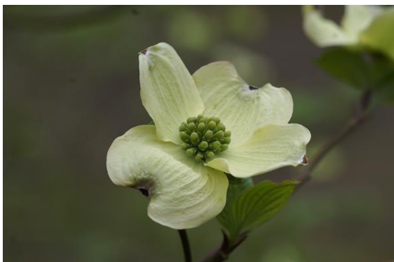
写真1 ハナミズキの花