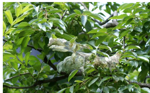
写真4 アメリカシロヒトリの巣網